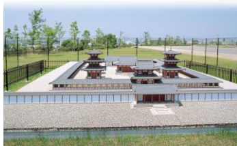
広渡廃寺跡歴史公園