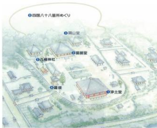
浄土寺伽藍配置マップ